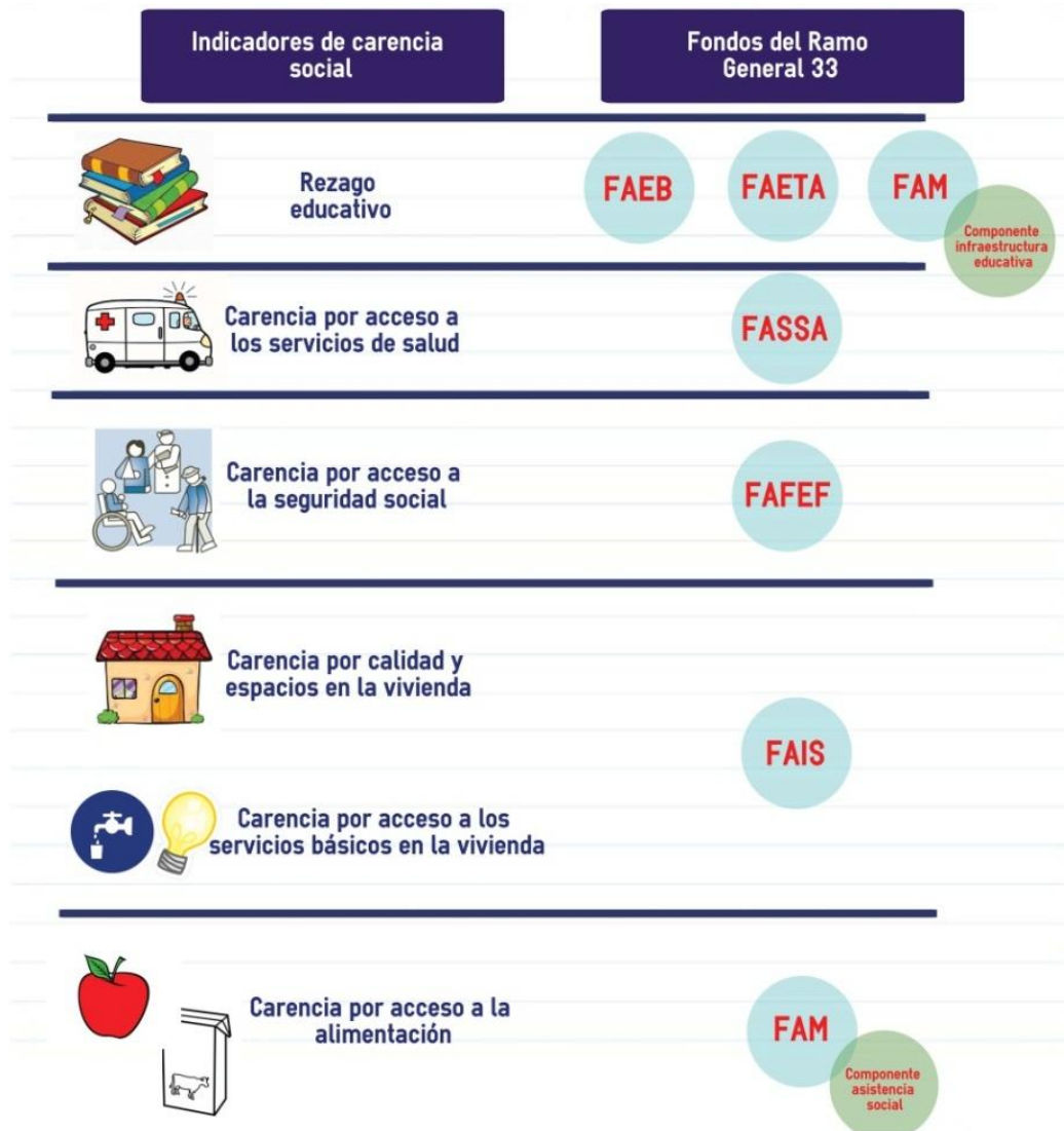
Figura 3. Relación de los fondos del Ramo General 33 con los indicadores de carencia social

El FASP y el FORTAMUN son fondos que no se pueden asociar directa o indirectamente a ninguno de los indicadores de la medición multidimensional de la pobreza.