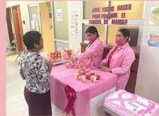
Stand: ¿Qué puedo hacer para prevenir el cáncer de mama?