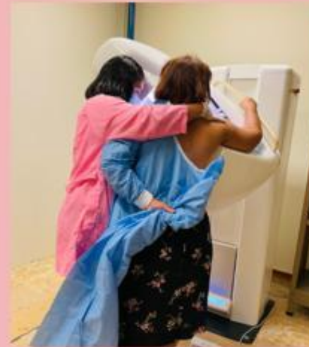
Tomas de mastografías