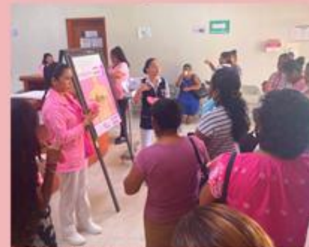
Stand: Autoexploración mamaria